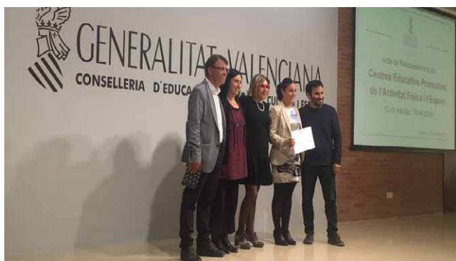
Las profesoras del área de Educación Física y la jefa de estudios del centro recogen el diploma de manos del Conseller de Educación.

La Conselleria de Educación ha vuelto a designar a Gençana como Centro Educativo Promotor de la Actividad Física y el Deporte (CEPAFE), un reconocimiento que se otorga a los centros escolares que fomentan el deporte base, la educación en valores y los hábitos de vida saludables dentro del Proyecto Educativo del Centro.