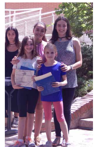
De izquierda a derecha: Cartel y vídeo del concierto que realizó 6º de Primaria "A coger el trébole"; Concierto del grupo de coro del centro; un momento de la ceremonia de entrega de los premios King Kong, Ulises Gráficos y Fotográficos, Marco Polo y de deportes, que se celebró en la plaza principal.