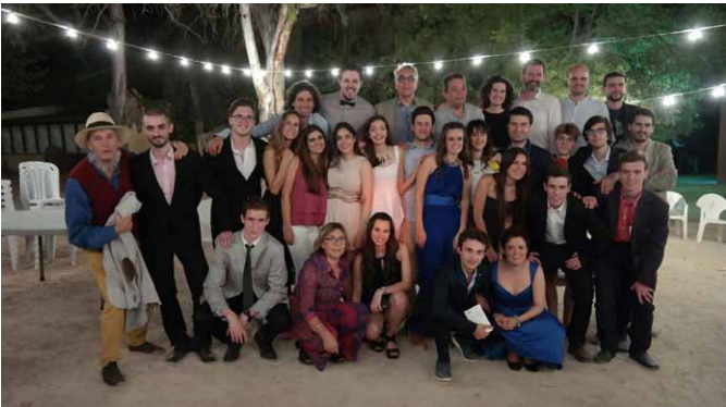
Arriba, un momento del acto de clausura del curso. Abajo, el grupo de 2º de Bachillerato, junto a profesores y equipo directivo del centro.

Tras la cena, se hizo entrega de diferentes reconocimientos a los alumnos de 2º de Bachillerato, mientras que los alumnos de tercero y cuarto de Secundaria ofrecieron un concierto en homenaje a sus compañeros. Tampoc faltaron las sorpresas en este acto, en el que se proyectaron vídeos realizados por padres, profesores y alumnos. Desde Gençana, les deseamos que sigan cosechando éxitos en su carrera académica.