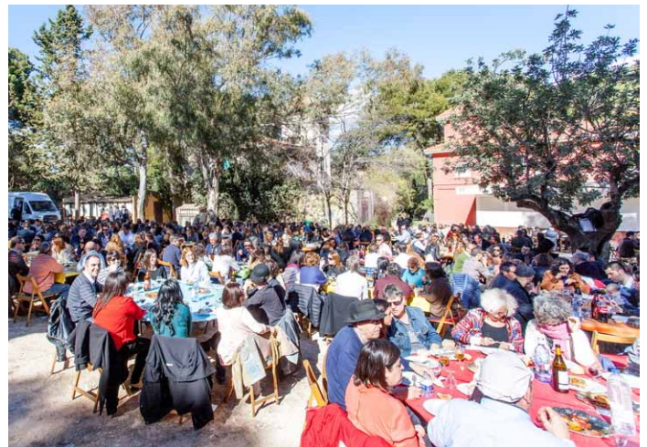
Arriba: diferentes momentos del Desfile Literario realizado por los alumnos del centro, que llevó por título "Brujas, electroduendes, máscaras y hadas". Abajo izquierda, durante la conferencia central del sábado 5 de marzo, que corrió a cargo de Manuel Vicent. Abajo derecha, comida del Carnaval Literario.