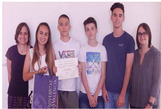
Los alumnos ganadores, junto a las profesoras de Plástica y Francés

Los alumnos de 4º de ESO se alzaron con los premios ganador y finalista del concurso organizado por la UV "Una imagen, un idioma".