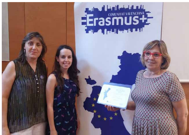
La jefa de estudios y la coordinadora del proyecto en el centro, junto a la representante de la Conselleria de Educación.

Gençana recibió el pasado viernes 1 de julio de parte de la Conselleria de Educación un diploma de reconocimiento por la participación en el programa europeo Erasmus+ KA101, de formación y movilidad del profesorado.