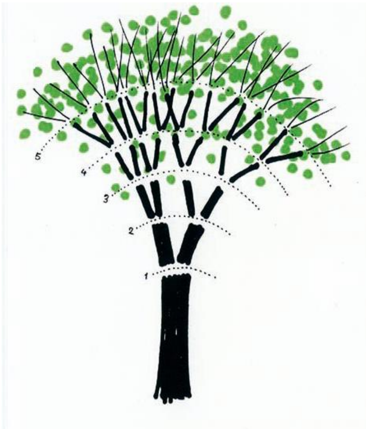
"Drawing a tree" Bruno Munari.

Los alumnos participaran semanalmente en un proyecto coordinado por la profesora de Arte del centro.