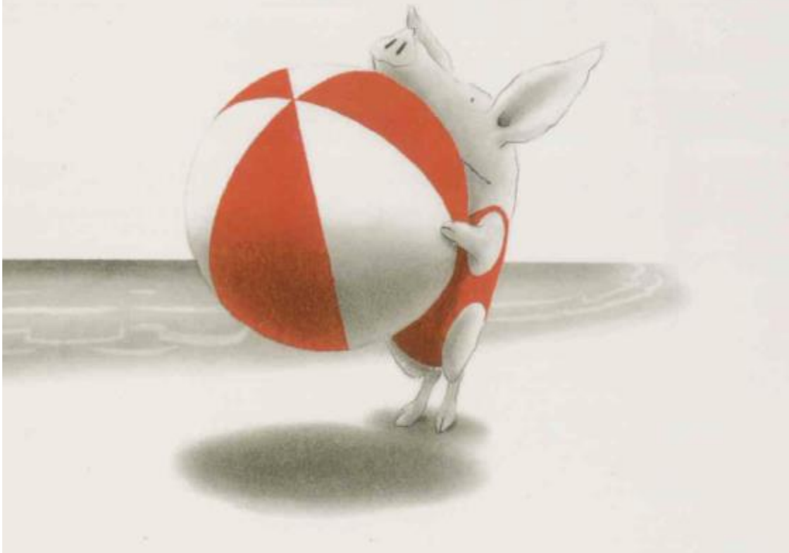
“Olivia” Ian Falconer