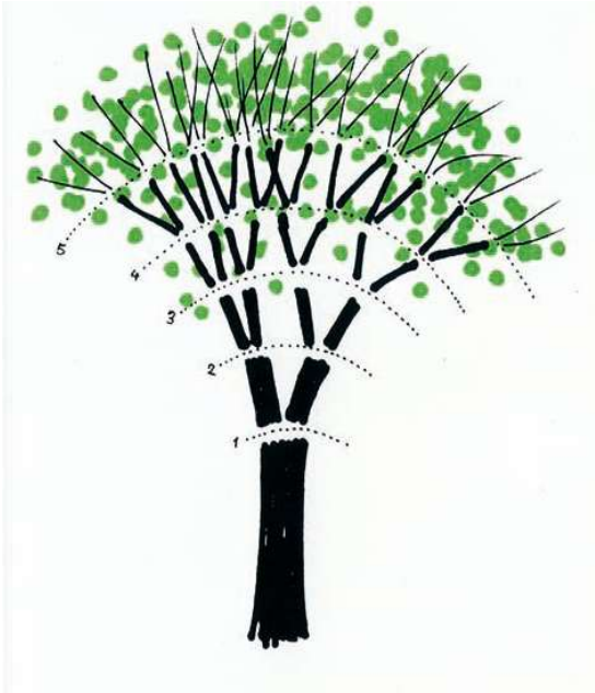
“Drawing a tree” Bruno Munari.

El lenguaje de comunicación empleado será el inglés con el personal cualificado del centro.