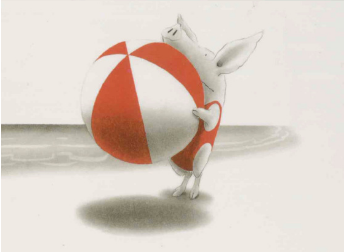
“Olivia” Ian Falconer

SUMMER SCHOOL JULY 2018 Curso de verano julio 2018