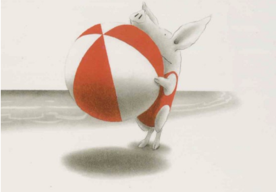
“Olivia” Ian Falconer