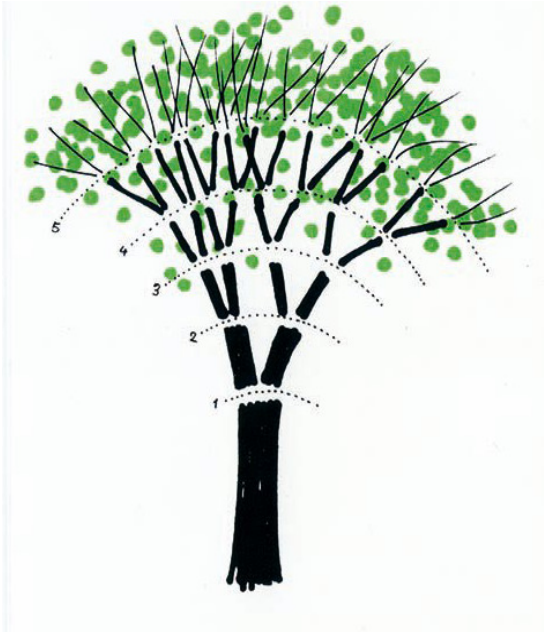
“Drawing a tree” Bruno Munari.

El lenguaje de comunicación empleado será el inglés con el personal cualificado del centro.