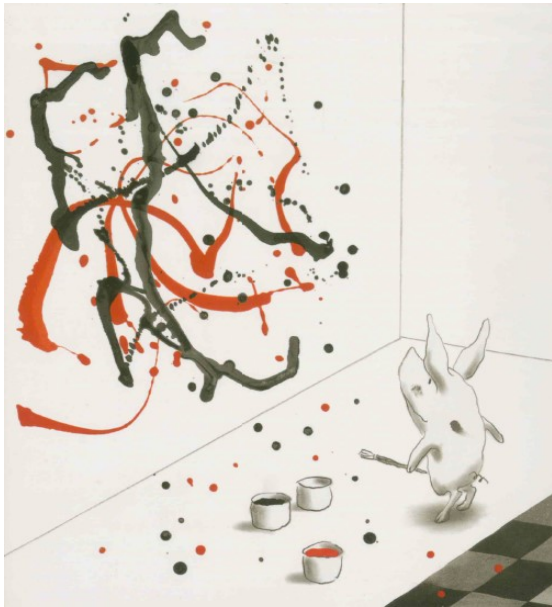
“Olivia” Ian Falconer.

English will be the language of communication used by the qualified staff. The summer school course for three and four-year-olds is aimed at developing their sensory skills (auditory, visual and motor), keeping habits and routines, developing socialization and improving both Reading and Writing skills as well as Calculus.