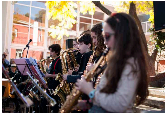
Arriba: diferentes momentos del Desfile Literario "A abrir la calle, a vivir la calle, a soñar la calle, a tomar la calle". Abajo izquierda, un momento del espectáculo de Alex Marionette por Mr. Barti. Abajo derecha, concierto de Gençana Big Band con el que se abrieron las actividades del sábado 10 de marzo.