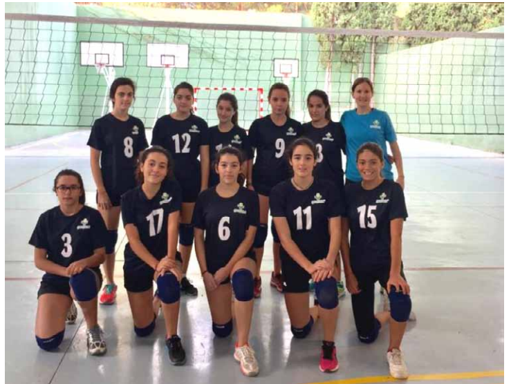
Alumnas integrantes del equipo de voleibol junto a su entrenadora antes del partido contra el CV Torrent.