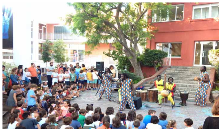
Actuación del grupo "Musiku Subatel" en el jardín principal

Los alumnos de Primaria y Secundaria dieron la bienvenida al nuevo curso de la mano del espectáculo "Musiku Subatel", a cargo del grupo Kirama Kergui. Un acercamiento al folklore de África, con danzas de Senegal y piezas musicales interpretadas por instrumentos de percusión y cuerda.