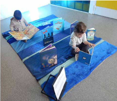
"AZUL, AZUL, AZUL PARA PINTAR LAS TARDES" El ojo 3