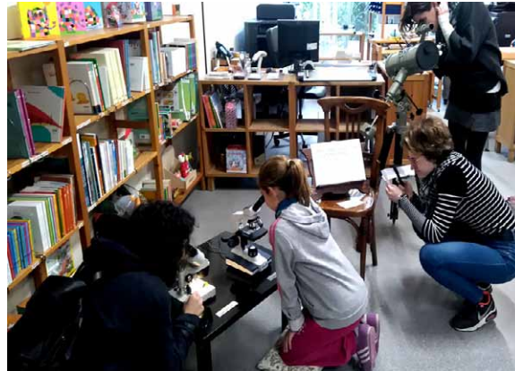
"¿HAS USADO ALGUNA VEZ INSTRUMENTOS ÓPTICOS?" El ojo 5