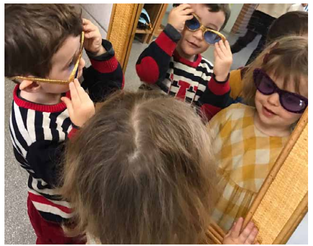
"USO LAS GAFAS... ¿PARA VERTE MEJOR?" El ojo 6