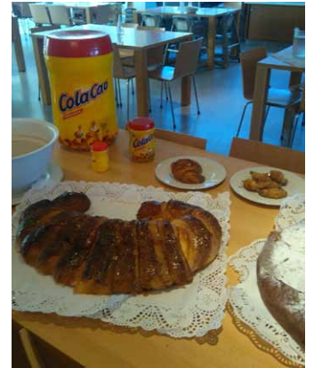
"HOMOTECIAS". El ojo 7