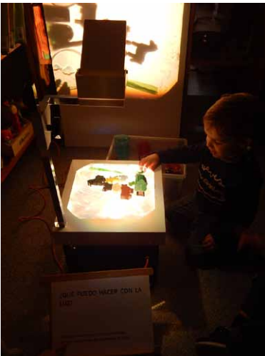
"¿QUÉ PUEDO HACER CON LA LUZ?" El ojo 4