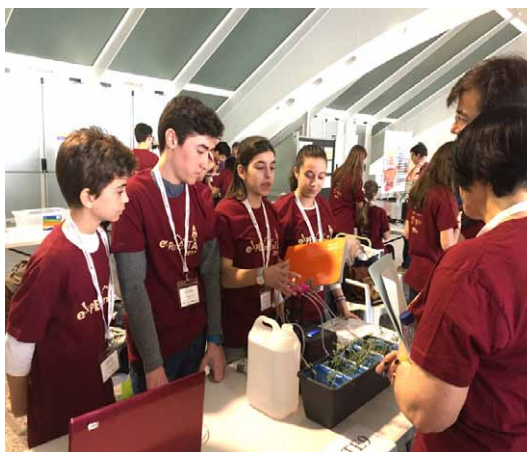
Izquierda: el proyecto “Lo que el humano oye, también lo ve” galardonado con una Mención de Honor en la categoría de Física. Derecha: los alumnos de 3º ESO explicando su proyecto “Perfeccionando la naturaleza” al jurado.