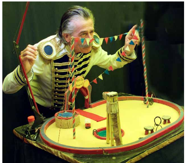
Arriba: diferentes momentos del Desfile Literario realizado por los alumnos del centro, que llevó por título “¡Ojol!”. Abajo izquierda, un momento de la conferencia central del sábado 11 de marzo, a cargo de Benjamín Prado. Abajo derecha, espectáculo “El Circo de las Pulgas”, de Dominique Kerignard.