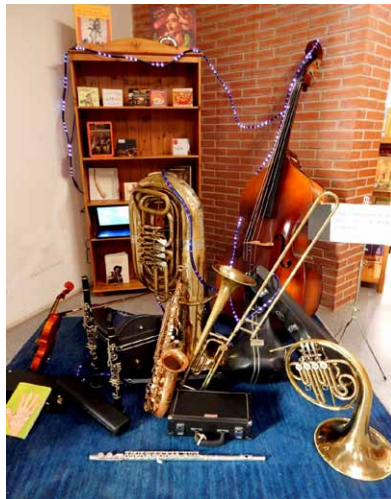
"THEY WHISPERED IN THE EARS..." Ear 1