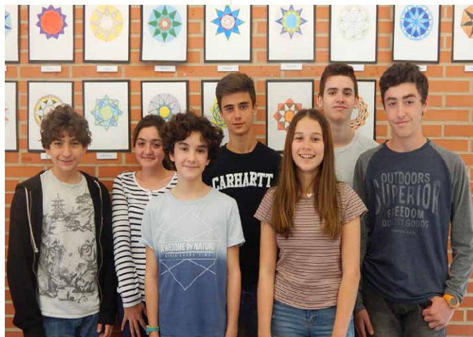
Alumnos clasificados para la fase provincial de la Olimpiada Matemática

El próximo 6 de mayo, los estudiantes clasificados disputarán la fase provincial del torneo en Riba-roja del Turia, donde tendrán que resolver pruebas individuales de velocidad como en equipo, incluida una prueba de campo que tendrán que realizar por las calles del municipio.