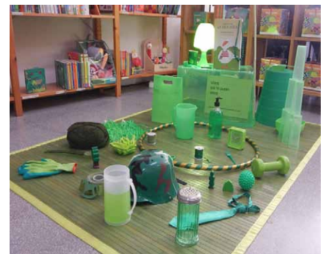
"VERDE, QUE TE QUIERO VERDE". El ojo 8