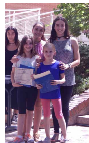
De izquierda a derecha: Cartel y vídeo del concierto que realizó 6º de Primaria "A coger el trébole"; Concierto del grupo de coro del centro; un momento de la ceremonia de entrega de los premios King Kong, Ulises Gráficos y Fotográficos, Marco Polo y de deportes, que se celebró en la plaza principal.