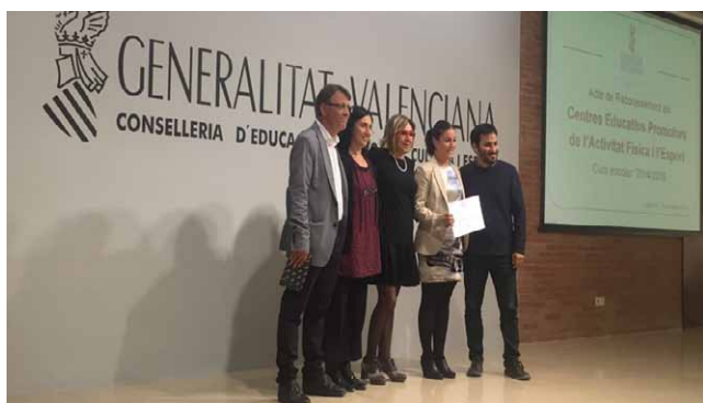
Las profesoras del área de Educación Física y la jefa de estudios del centro recogen el diploma de manos del Conseller de Educación.

La Conselleria de Educación ha vuelto a designar a Gençana como Centro Educativo Promotor de la Actividad Física y el Deporte (CEPAFE), un reconocimiento que se otorga a los centros escolares que fomentan el deporte base, la educación en valores y los hábitos de vida saludables dentro del Proyecto Educativo del Centro.