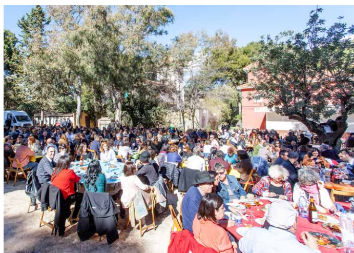
Arriba: diferentes momentos del Desfile Literario realizado por los alumnos del centro, que llevó por título "Brujas, electroduendes, máscaras y hadas". Abajo izquierda, durante la conferencia central del sábado 5 de marzo, que corrió a cargo de Manuel Vicent. Abajo derecha, comida del Carnaval Literario.