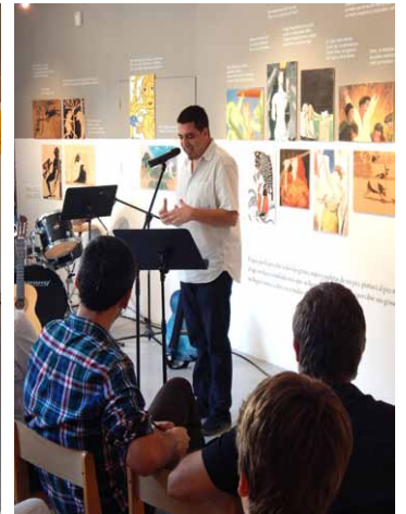
Algunos de los momentos de la presentación del Proyecto Miradas