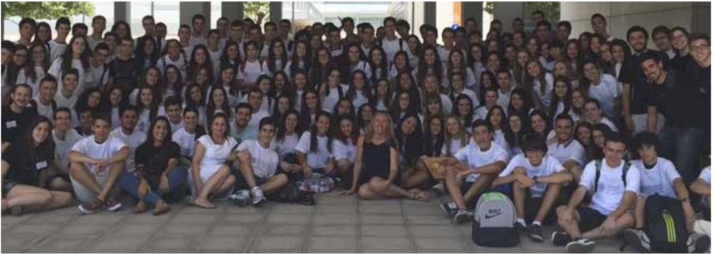
Fotografía de grupo con todos los participantes en la edición 2015 del Campus Praktikum.

Para concluir, considerando esta una experiencia muy enriquecedora y útil para la toma de decisiones futuras, recomendamos encarecidamente la participación de aquellos alumnos que estén interesados.