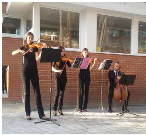
Izquierda: espectáculo de Sedajazz con los alumnos de Primaria en el jardín principal. Derecha: actuación del cuarteto de cuerda en el jardín de Educación Infantil.